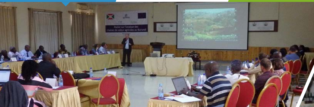
Réunion de restitution de l'Etude préalable