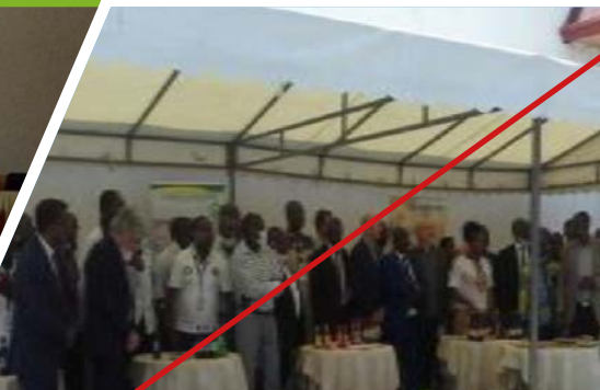
Lancement officiel de la plateforme